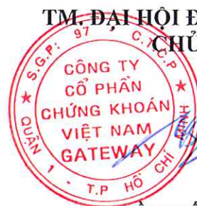
TRẦN TỔNG SÁNG